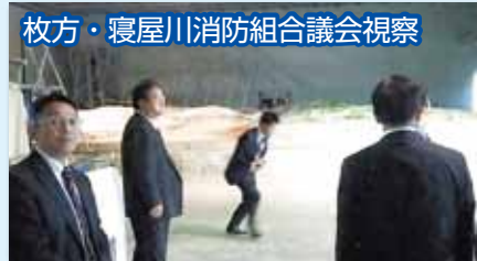
枚方・寝屋川消防組合議会視察