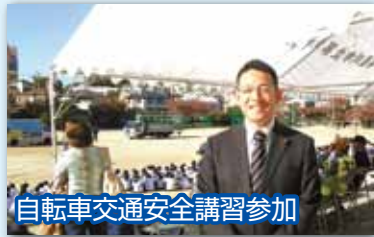
自転車交通安全講習参加