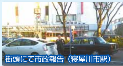
街頭にて市政報告 (寝屋川市駅)