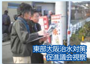
東部大阪治水対策 促進議会視察