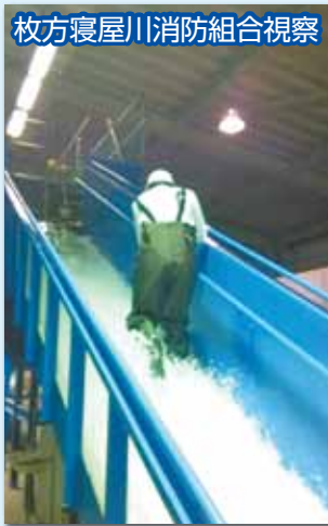
枚方寝屋川消防組合視察