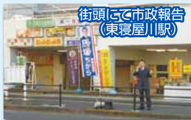
街頭にて市政報告 (東寝屋川駅)