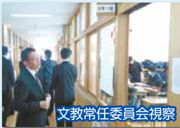
文教常任委員会視察